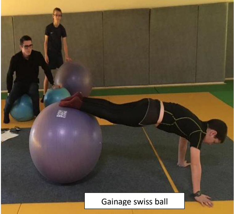
Gainage swiss ball