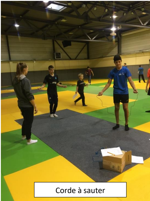
Corde à sauter

Ensuite c'est parti pour 10 ateliers pour tester sa condition physique :